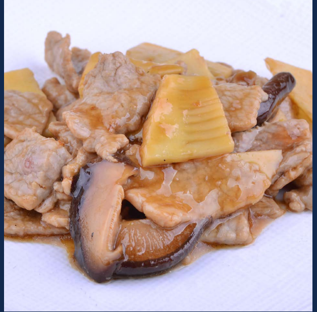
156. Manzo bambù funghi