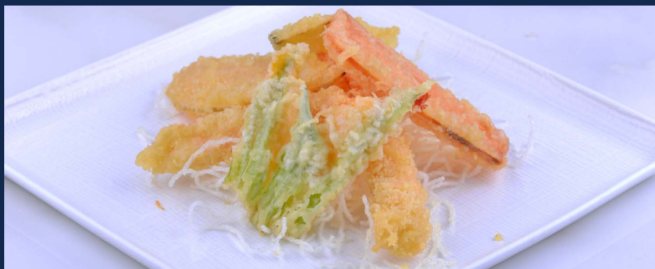
170. Tempura mista