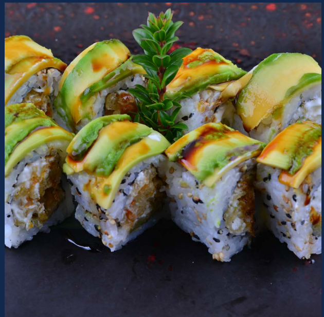
75. Vegetariano Fiore di zucca fritto, Philadelphia ricoperto avocado e salsa teriyaki