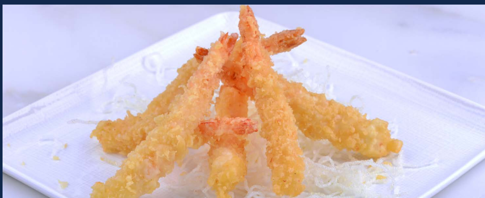
173. Ebi tempura Gamberi