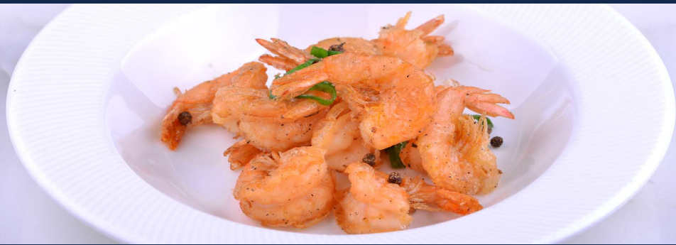
151. Gamberi sale e pepe