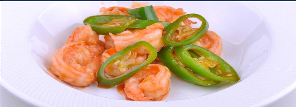
150. Gamberi con peperoncino verde