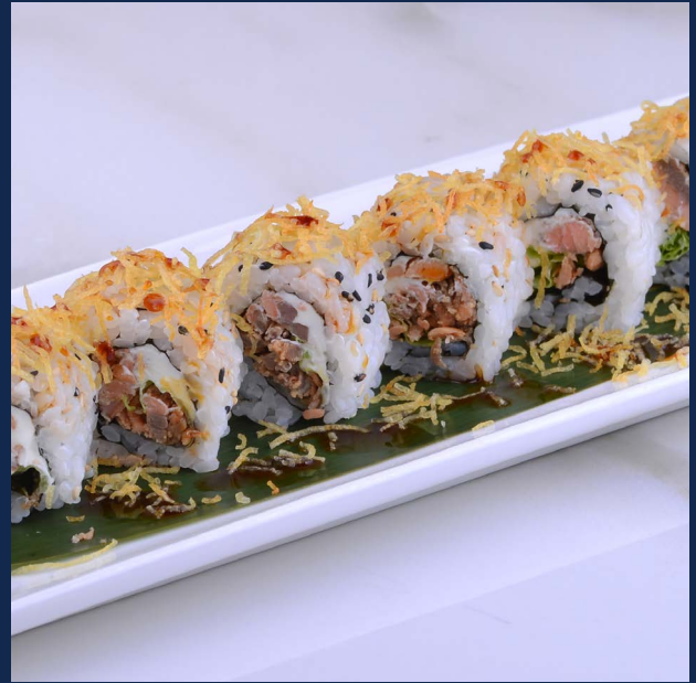
73. Miura Salmone grigliato, insalata, Philadelphia, salsa teriyaki