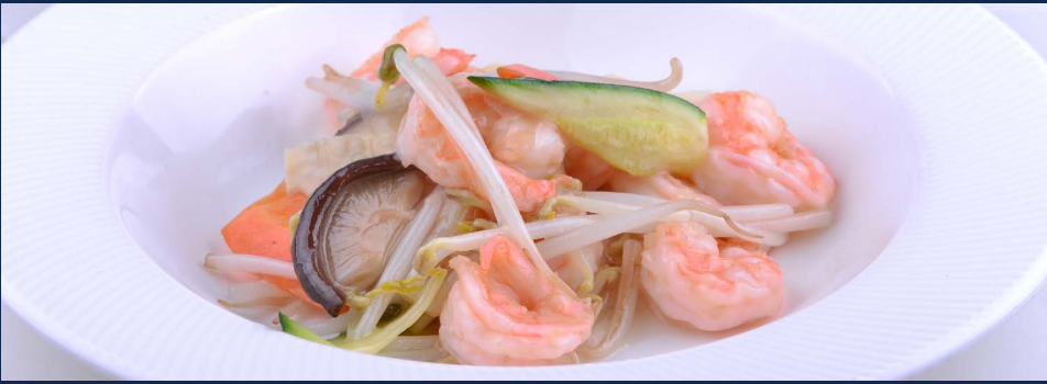
149. Gamberi con verdure di stagione