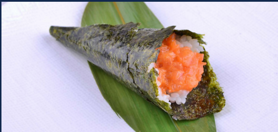
117. Spicy salmone Salmone piccante Allergeni: 3-4