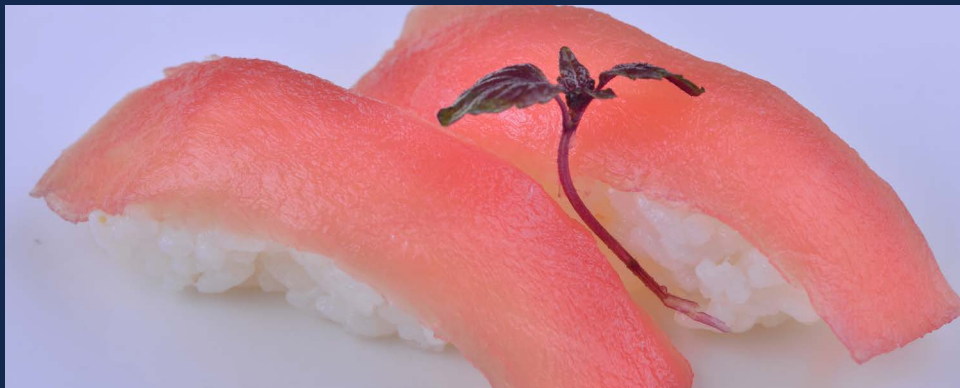
50. Nighiri tonno