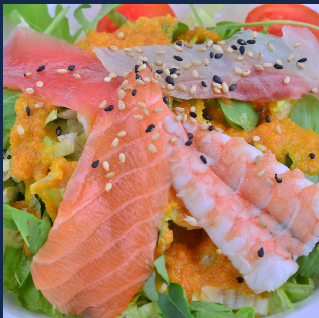
14. Insalata con pesce misto