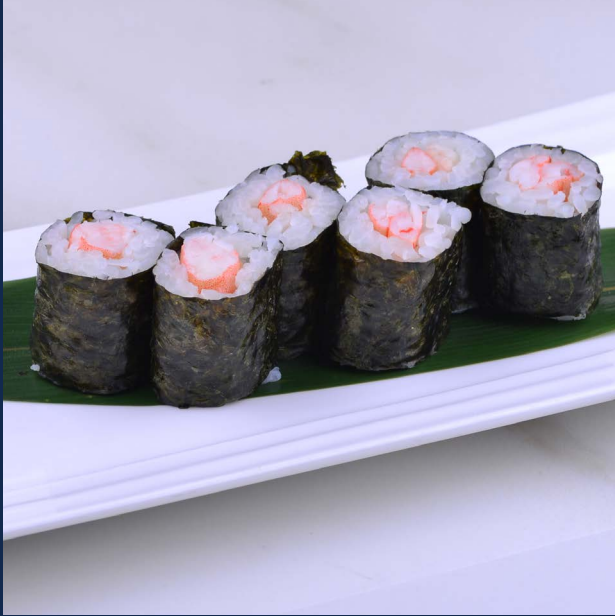
109. Ebi Gambero cotto