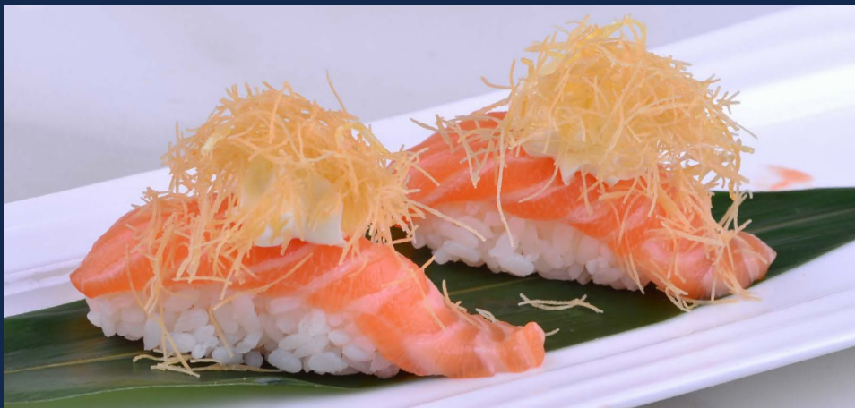
54. Nighiri cheese