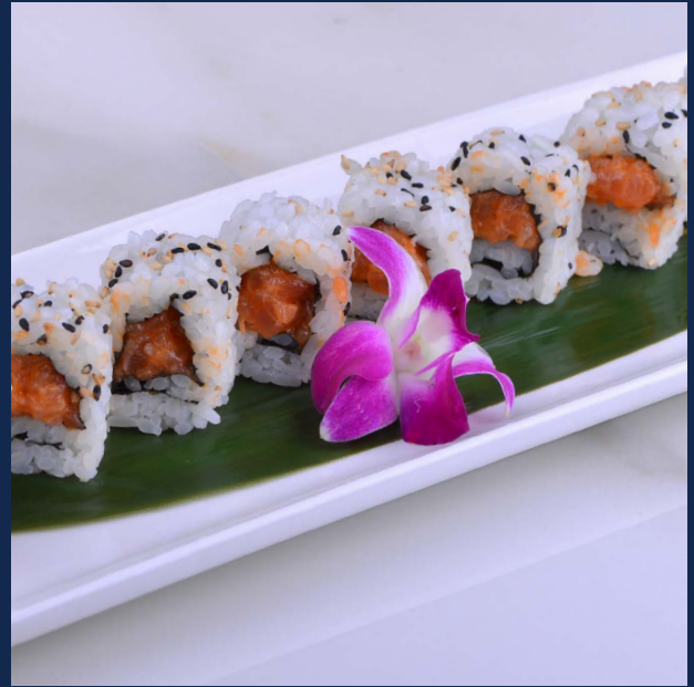
69. Spicy salmon