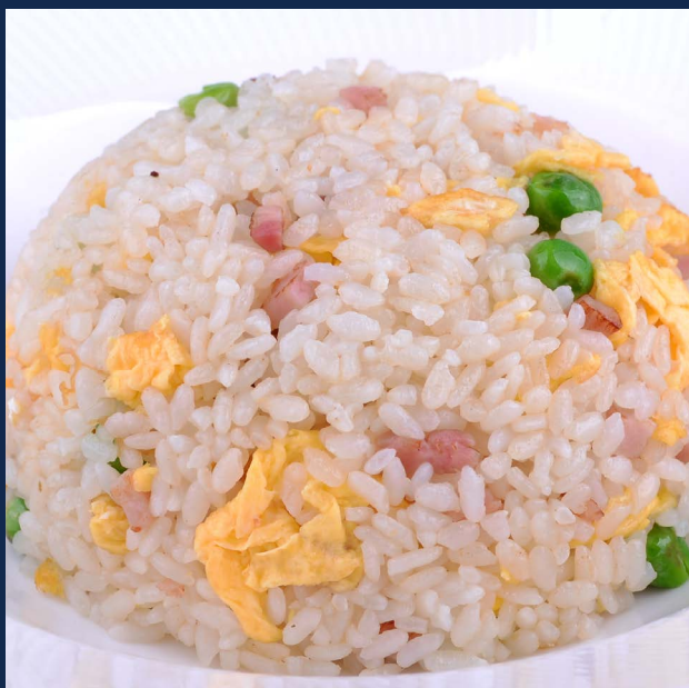
131. Riso cantonese