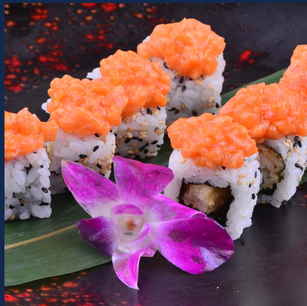
89. Spicy roll