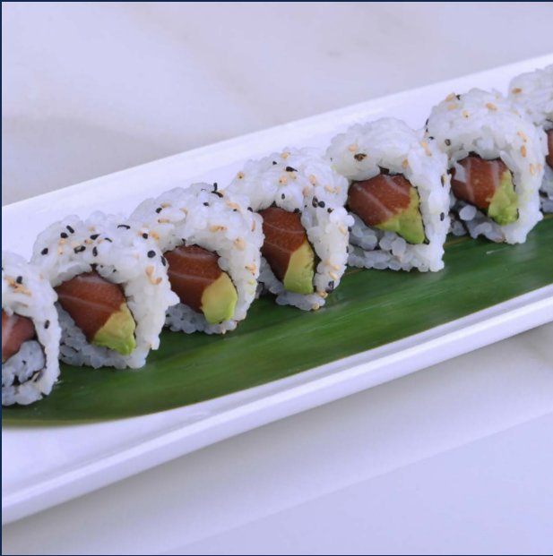
68. Salmone avocado