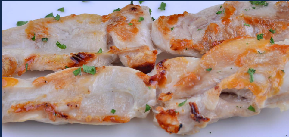
184. Spiedini di pollo