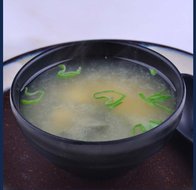
11. Zuppa di miso