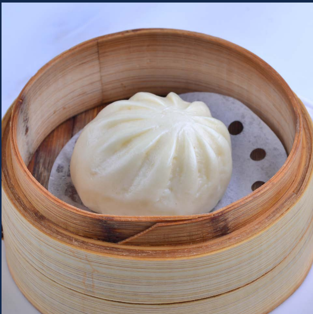
08. Pane con fagioli rossi