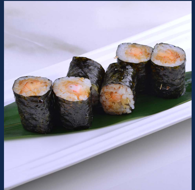
108. Ebi fritto Gambero fritto Allergeni: 1-2-6