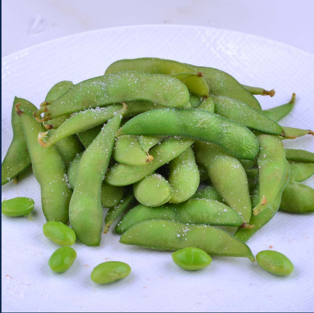
10. Fagiolini di soia