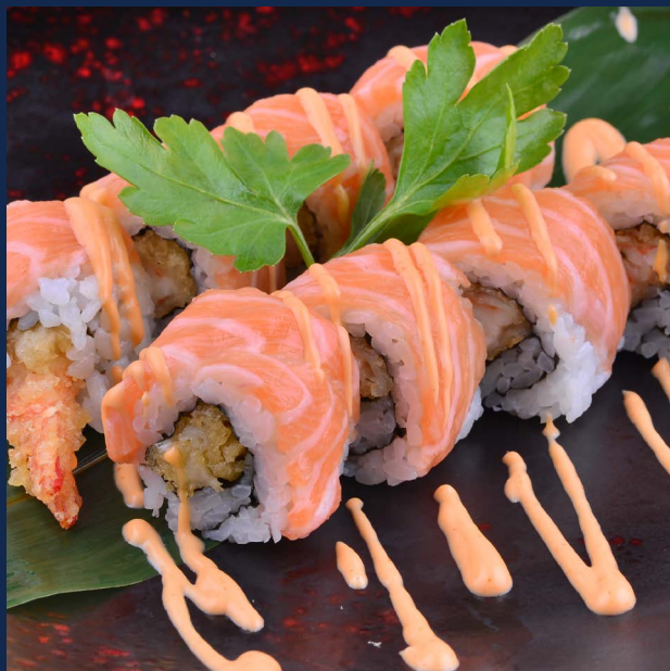
83. Tiger roll spicy

Gambero fritto, maionese, ricoperto da salmone con salsa piccante.