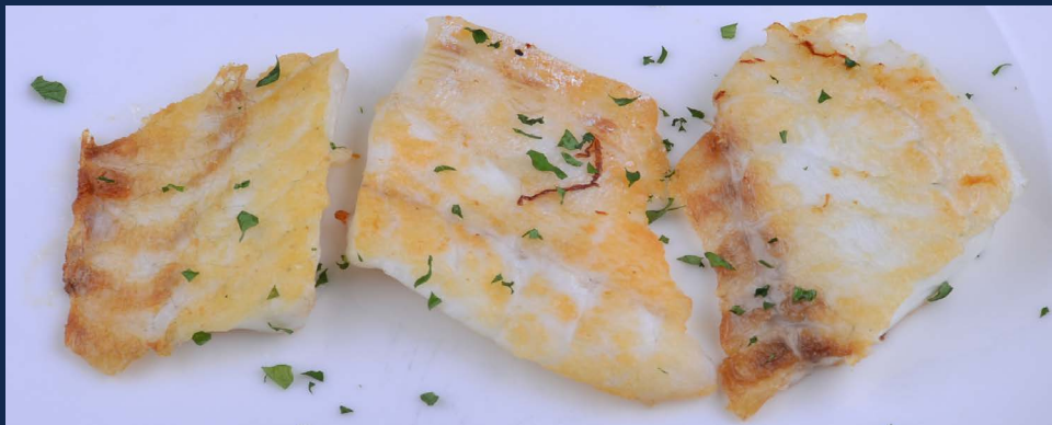
180. Branzino alla piastra