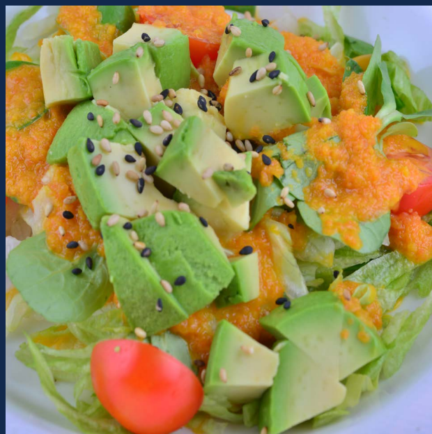
17. Insalata con avocado