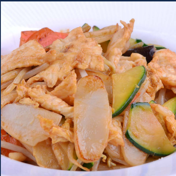
143. Gnocchi di riso con pollo e verdure