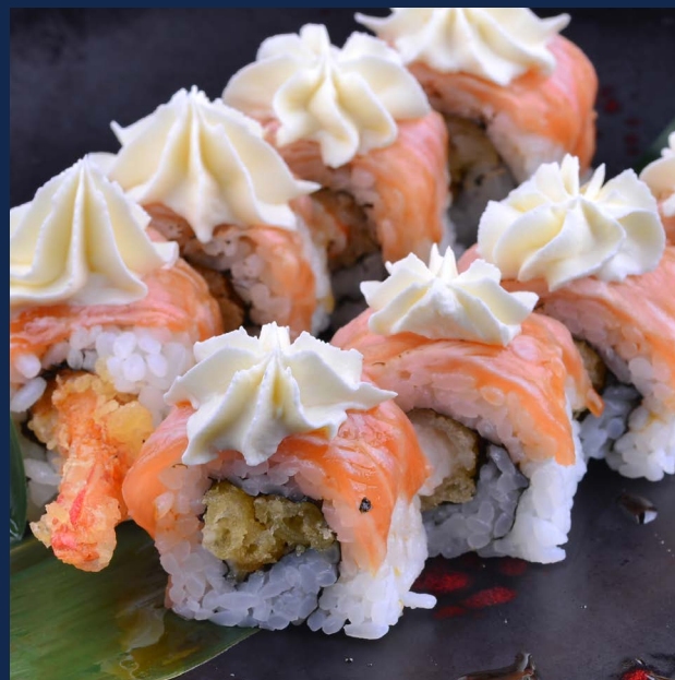
82. Tiger roll speciale

Philadelphia, gambero fritto, salmone scottato, salsa teriyaki.