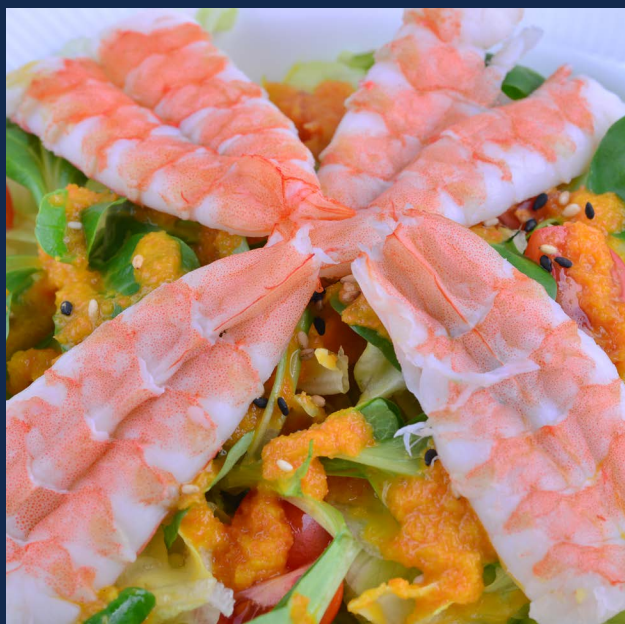
16. Insalata di gamberi