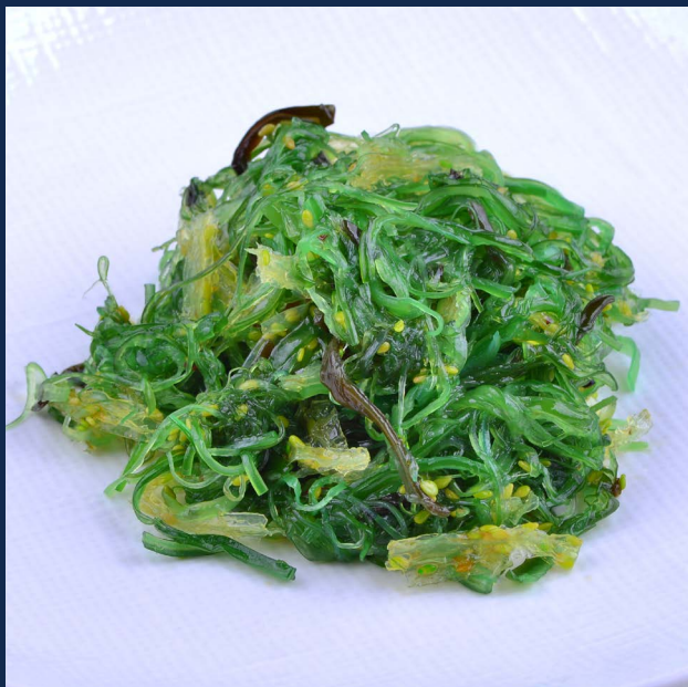
12. Gomma wakame Alghe giapponesi Allergeni 1-11