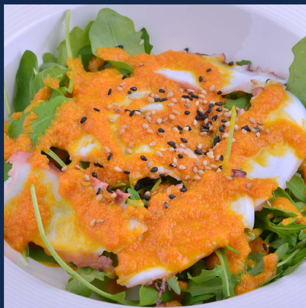
19. Polipo e rucola