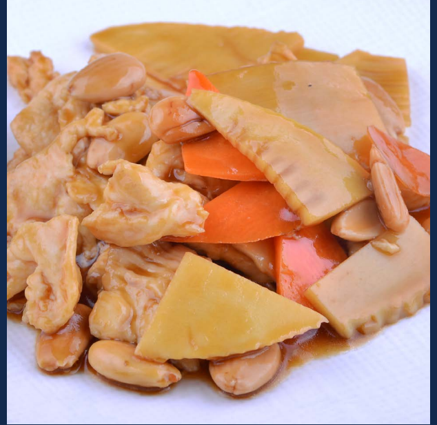
160. Pollo con mandorle