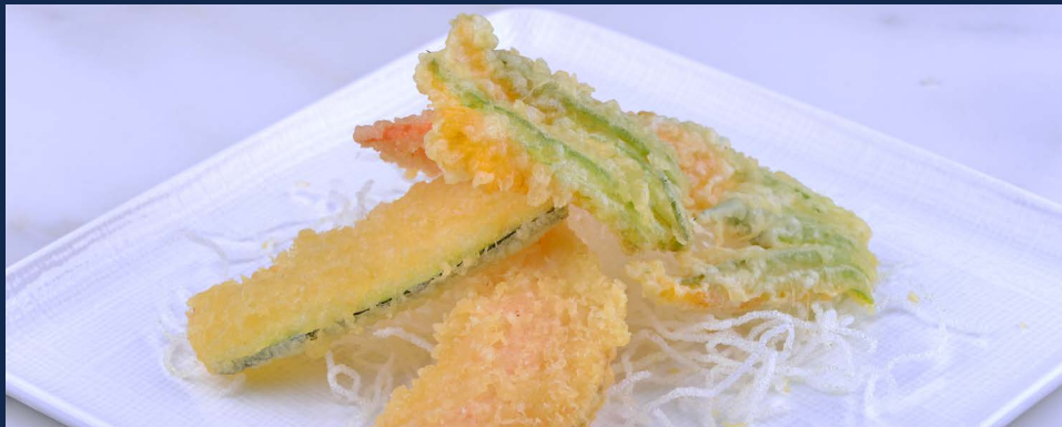
174. Yasai tempura Verdure