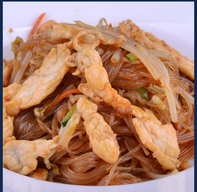
136. Spaghetti di soia con pollo