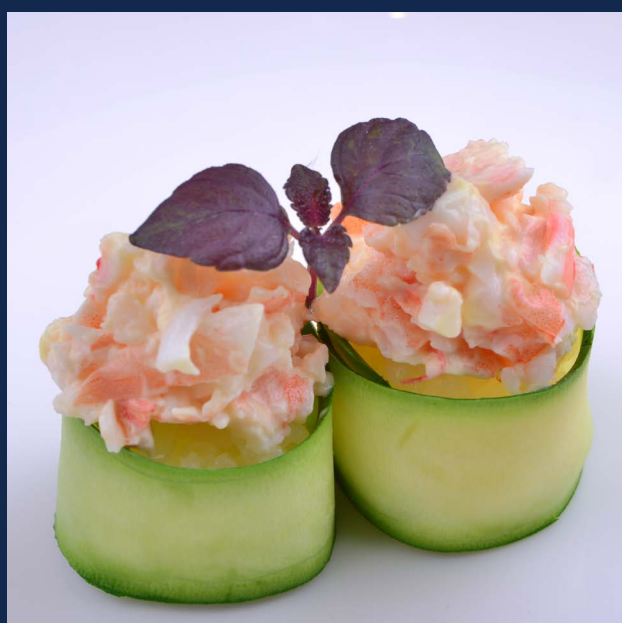
59. Gunkan zucchini

Zucchine all'esterno, gamberi cotti, maionese