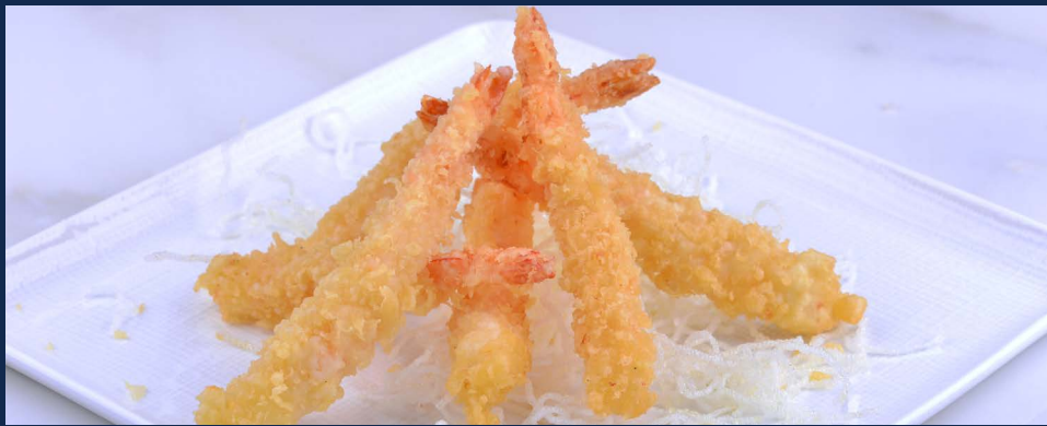
173. Ebi tempura Gamberi