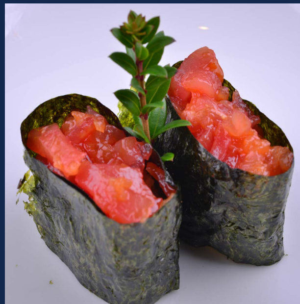
58. Gunkan tonno

Alga all'esterno, tonno piccante e maionese