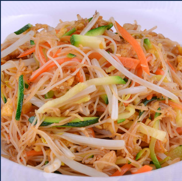
139. Spaghetti di riso con verdure