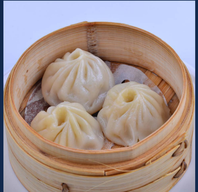
07. Xiaolong bao