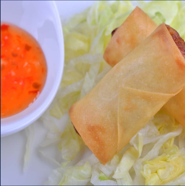
01. Involtino verdure 2 pz