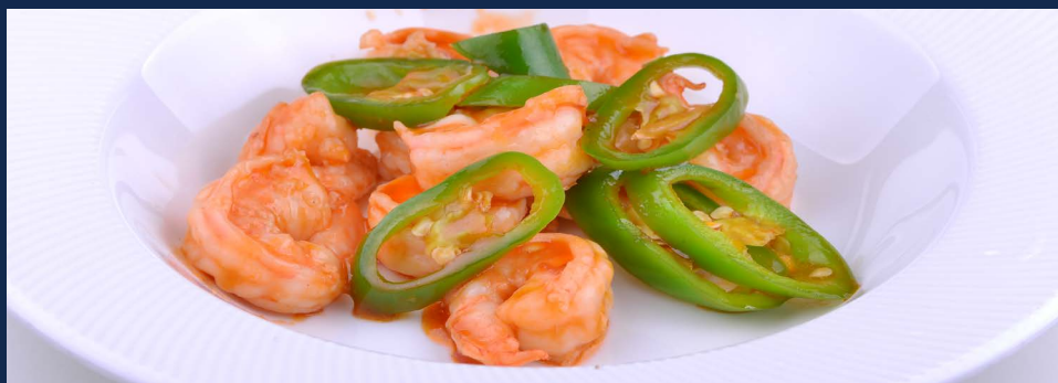
150. Gamberi con peperoncino verde