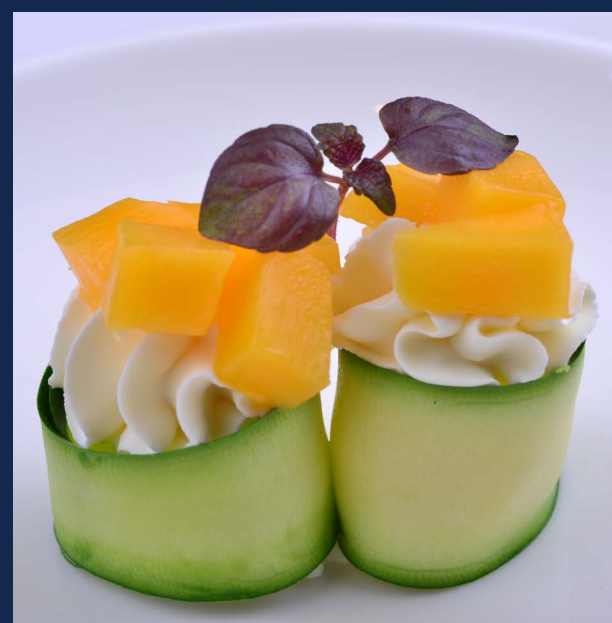
60. Gunkan zucchini speciale

Zucchine all'esterno, mango, Philadelphia