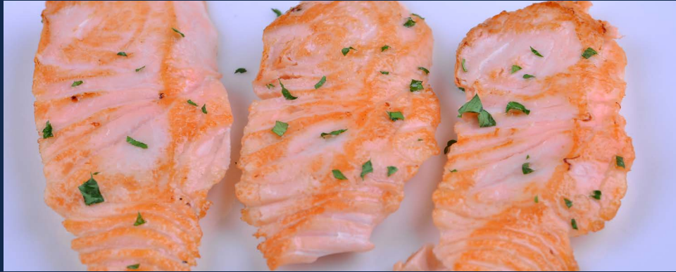
179. Salmone alla piastra