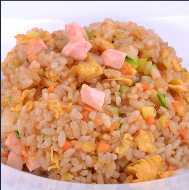
133. Riso con salmone