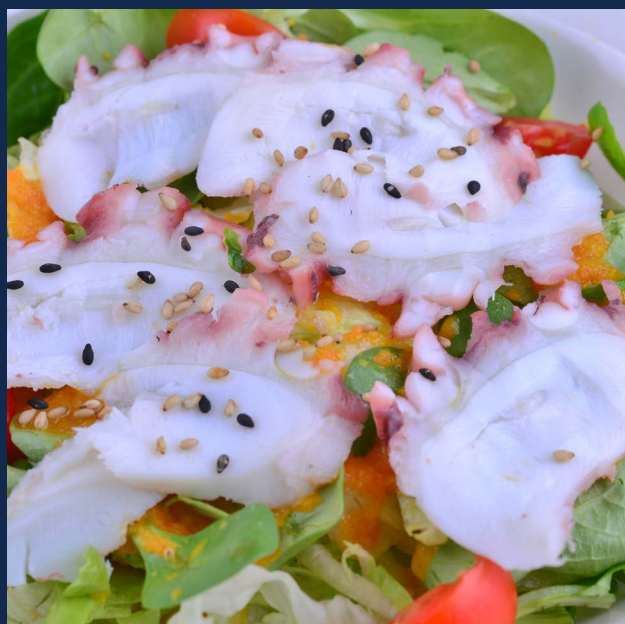
18. Insalata con polipo