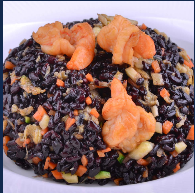
130. Riso venere con gamberi e verdure