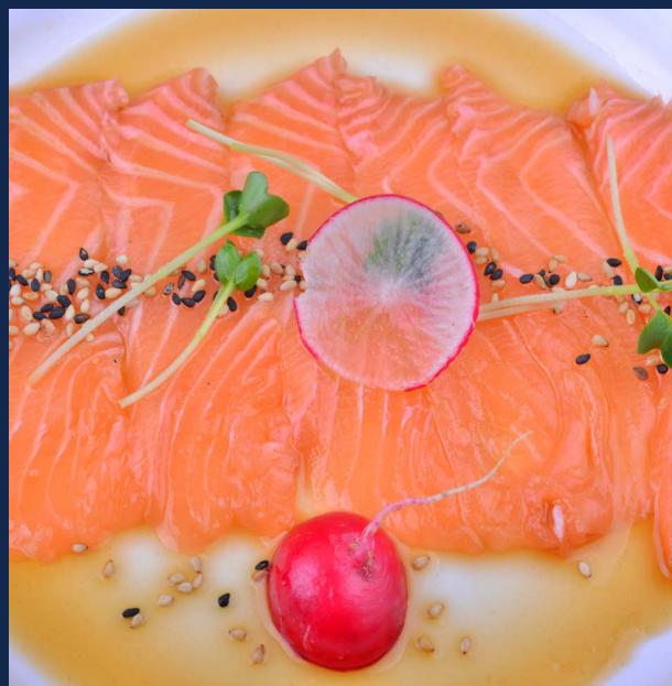
26. Carpaccio salmone Massimo 1 porzione a persona Allergeni 1-4-6-11