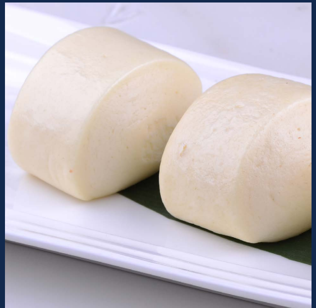
09. Pane cinese