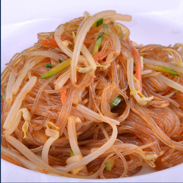
137. Spaghetti di soia con verdure