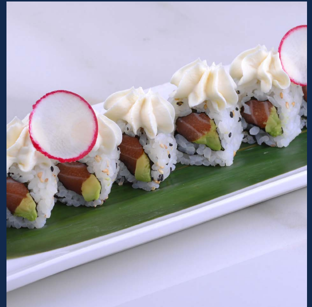
71. Sake bianco