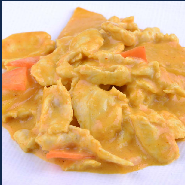
161. Pollo in salsa curry con patate