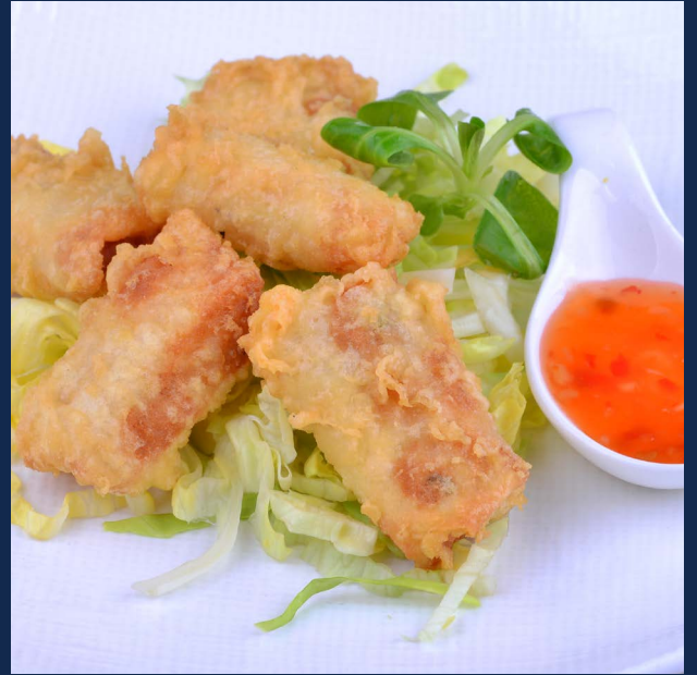
02. Involtino gamberi 4pz