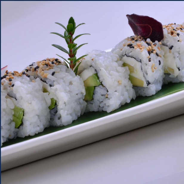
74. Philadelphia Philadelphia e avocado