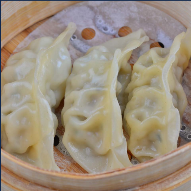
06. Ravioli con pollo 3 pz