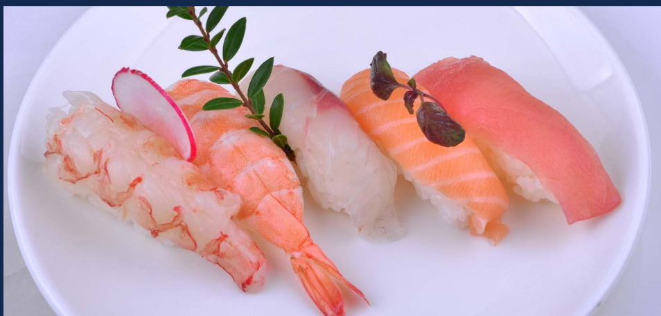
55. Nighiri misto (5 pezzi)