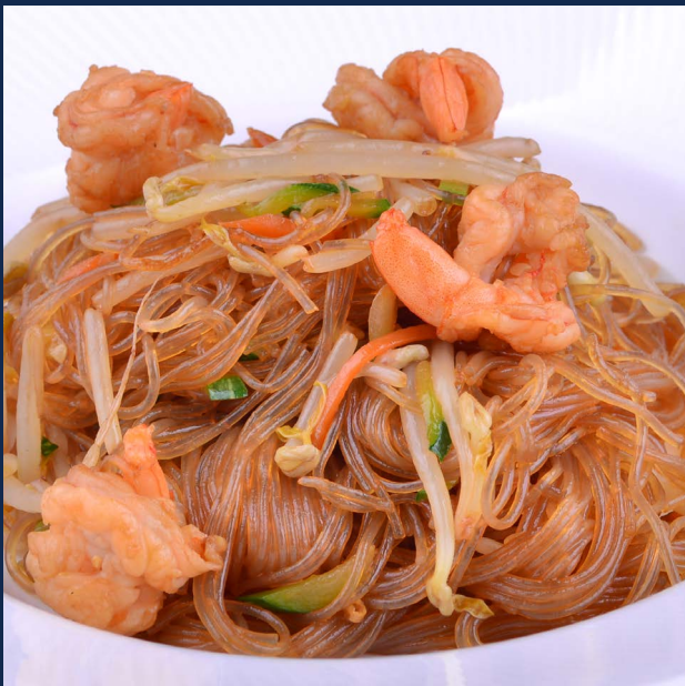
135. Spaghetti di soia con gamberi