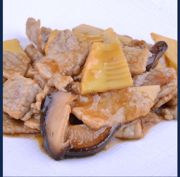
156. Manzo bambù funghi