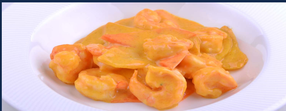
154. Gamberi in salsa curry con patate