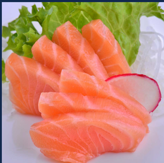
37. Sashimi salmone Massimo 1 porzione a persona 5 pezzi Allergeni 4