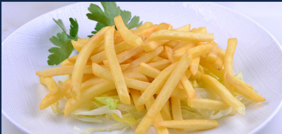
177. Patatine fritte