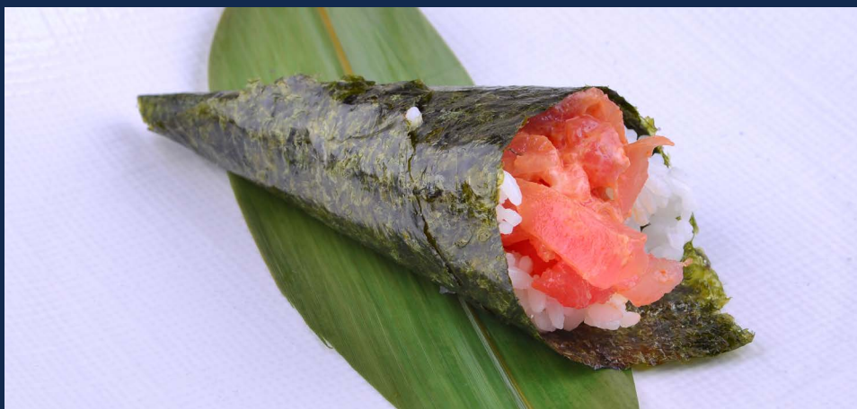
118. Spicy tuna Tonno piccante Allergeni: 3-4