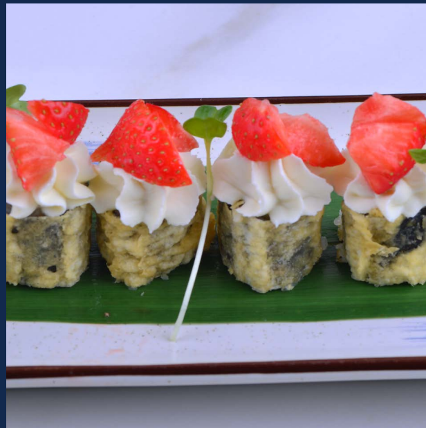
113. Hosso fragola Philadelphia, fragola (fritto) Allergeni: 1-7