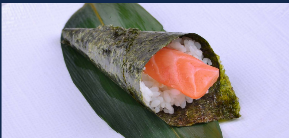
119. Sake bianco Salmone e Philadelphia Allergeni: 4-7