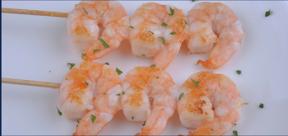
182. Spiedini di gamberi