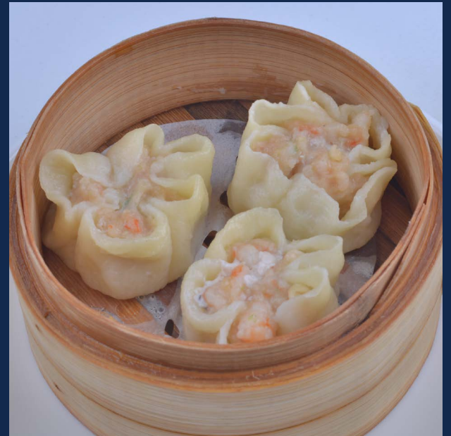
05. Ravioli con gamberi 3 pz