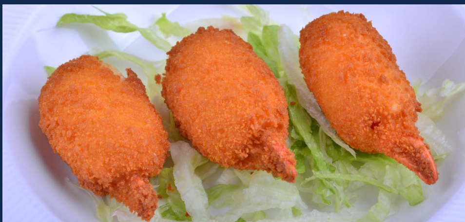
178. Chele di granchio