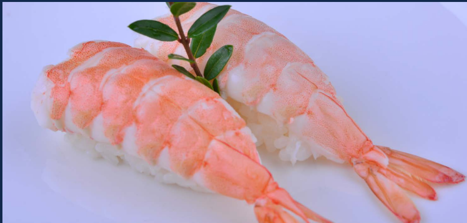
53. Nighiri gambero cotto