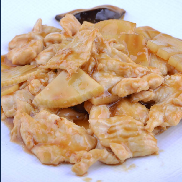
159. Pollo bambù funghi