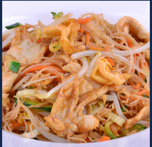
140. Spaghetti di riso con pollo e verdure