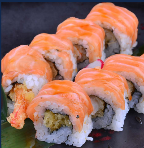
81. Tiger roll

Gambero fritto, maionese, ricoperto da salmone, salsa teriyaki.