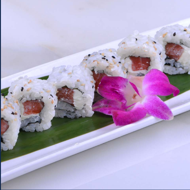
72. Sake speciale Salmone, Philadelphia