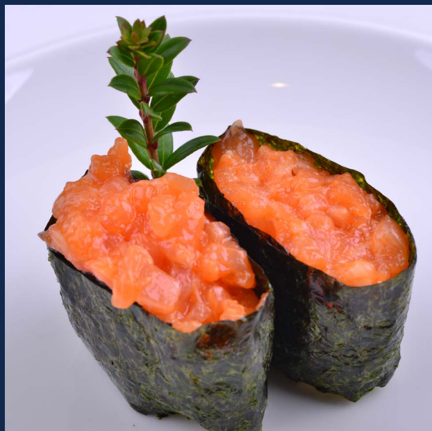
57. Gunkan salmone

Alga all'esterno, salmone piccante e maionese