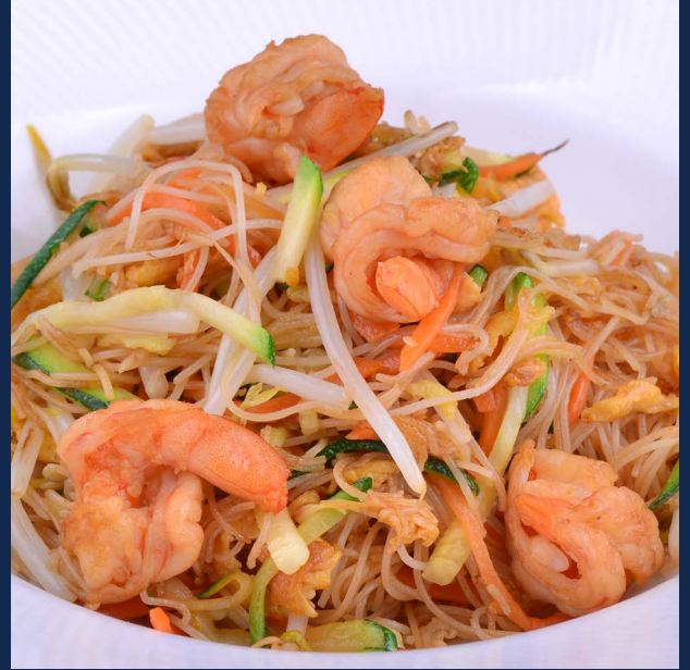
138. Spaghetti di riso con gamberi e verdure