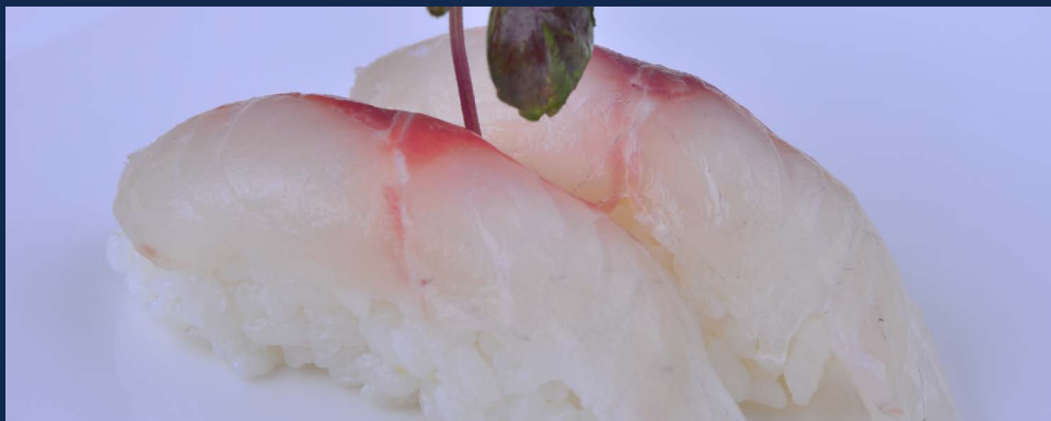
51. Nighiri branzino