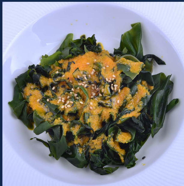
13. Wakame salad