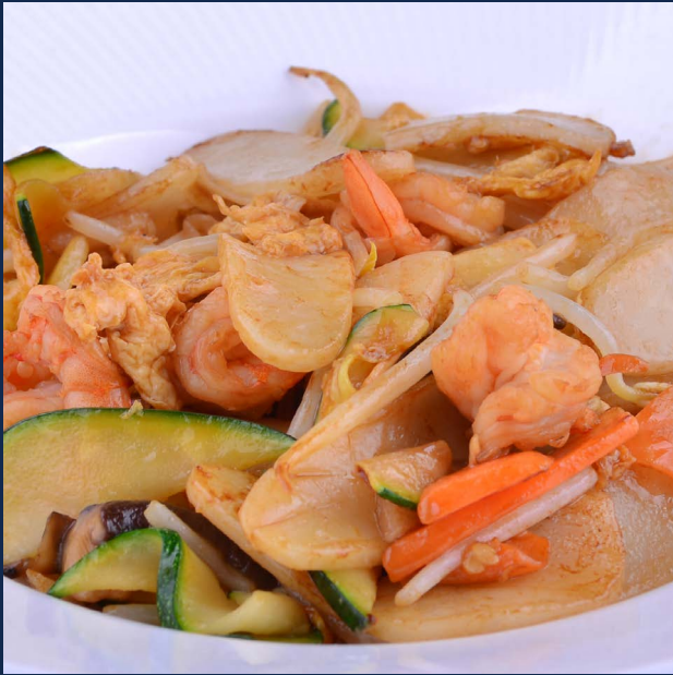
141. Gnocchi di riso con gamberi e verdure