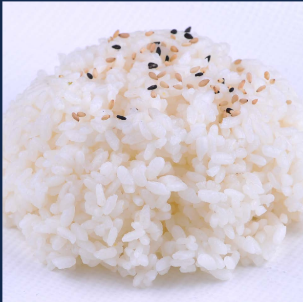
129. Riso bianco