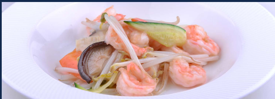
149. Gamberi con verdure di stagione