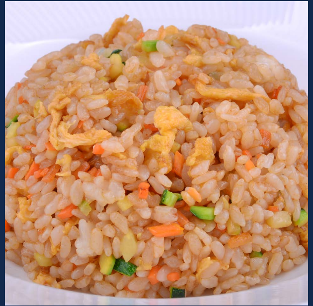
134. Riso con misto di verdure