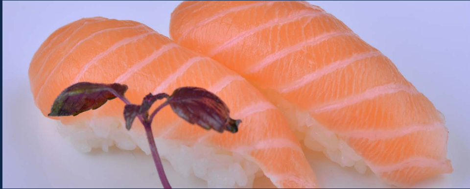
49. Nighiri salmone