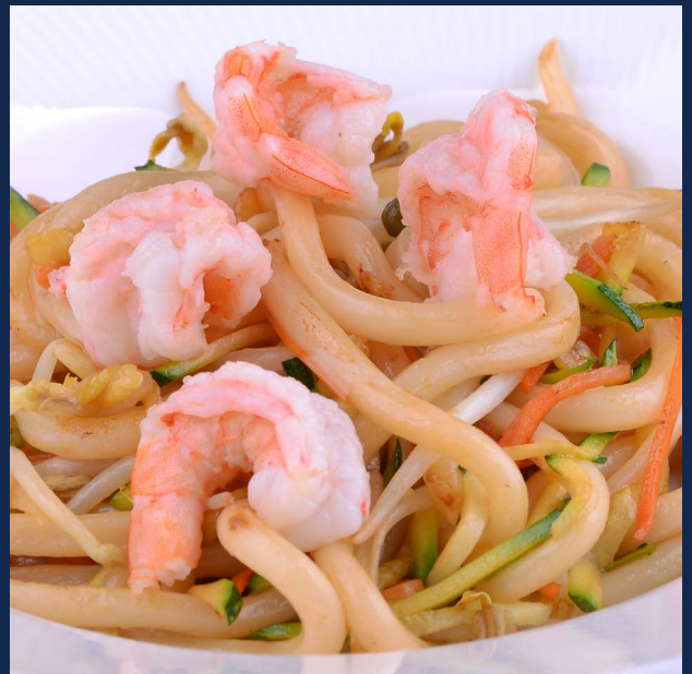
144. Yaki udon Pasta di farina di frumento con gamberi e verdure