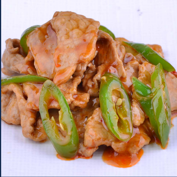
155. Manzo con peperoncino verde