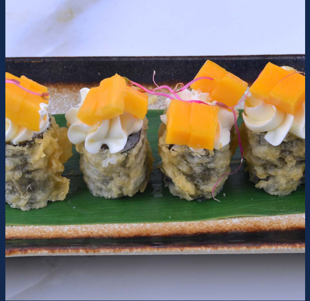
112. Hosso mango Philadelphia, mango (fritto) Allergeni :1-7