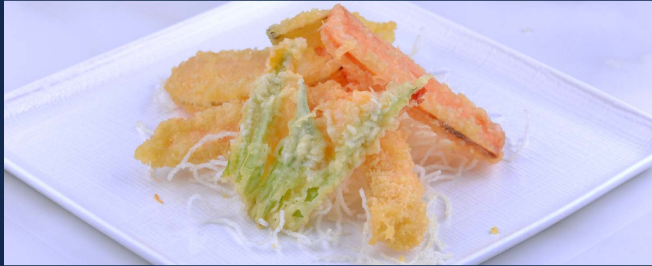
170. Tempura mista