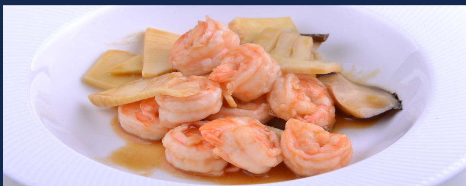
153. Gamberi bambù funghi