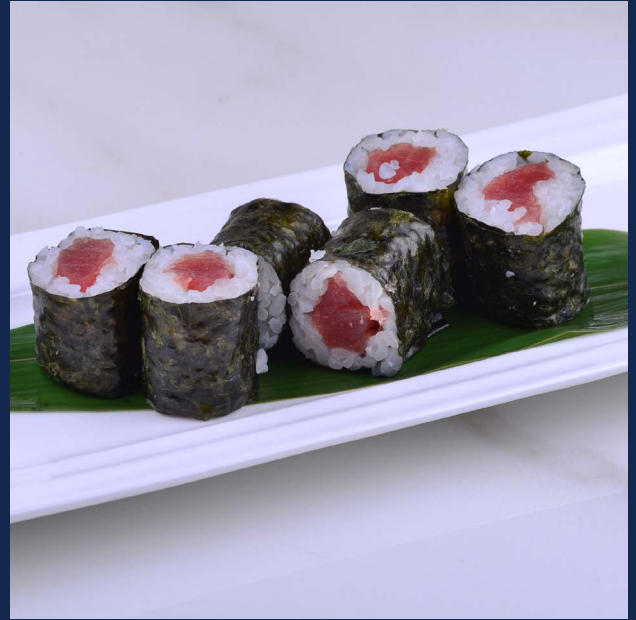
106. Tekka Tonno