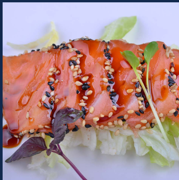
185. Salmone scottato in crosta di sesamo con salsa teriyaki Massimo 1 porzione a persona Allergeni: 1-4-6-11