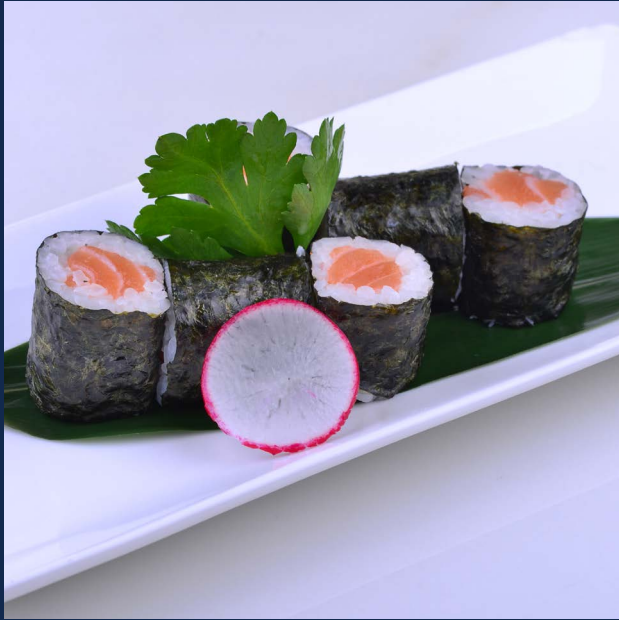
105. Sake Salmone