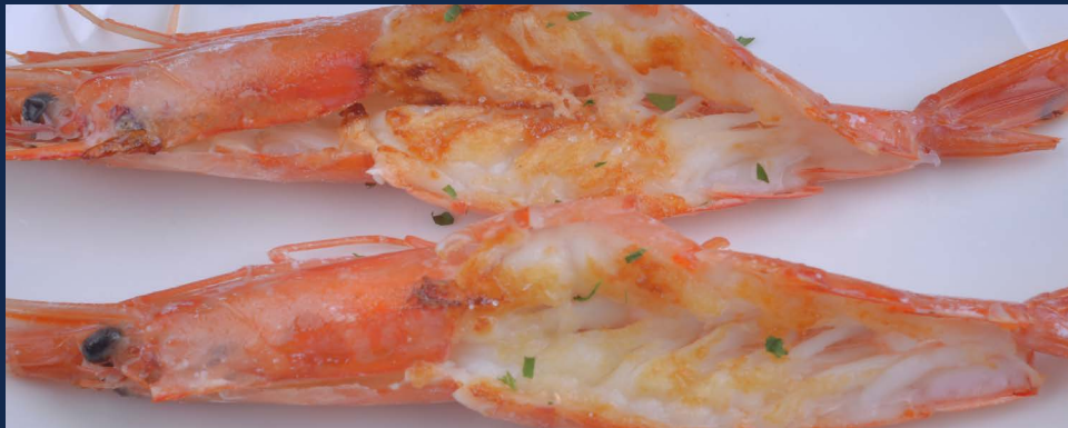
181. Gamberoni alla piastra