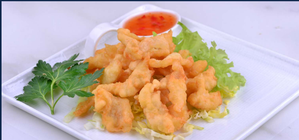
176. Pollo fritto