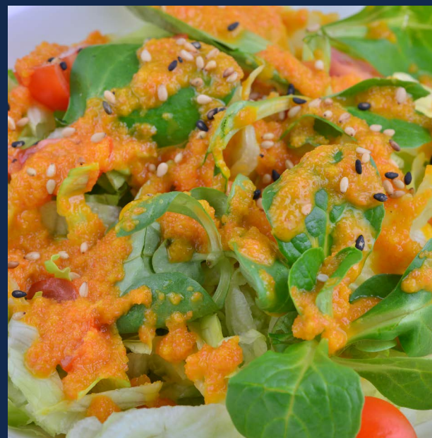
15. Insalata mista