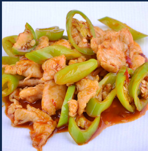
158. Pollo con peperoncino verde