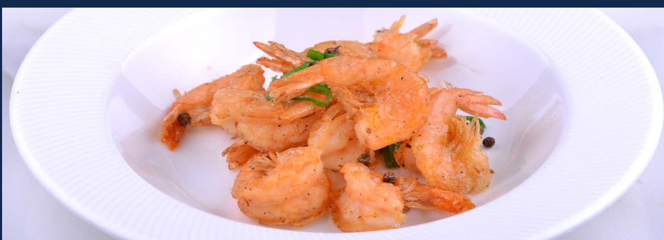
151. Gamberi sale e pepe