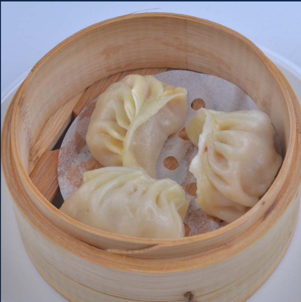
04. Ravioli con carne 3 pz