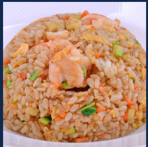
132. Riso con gamberi