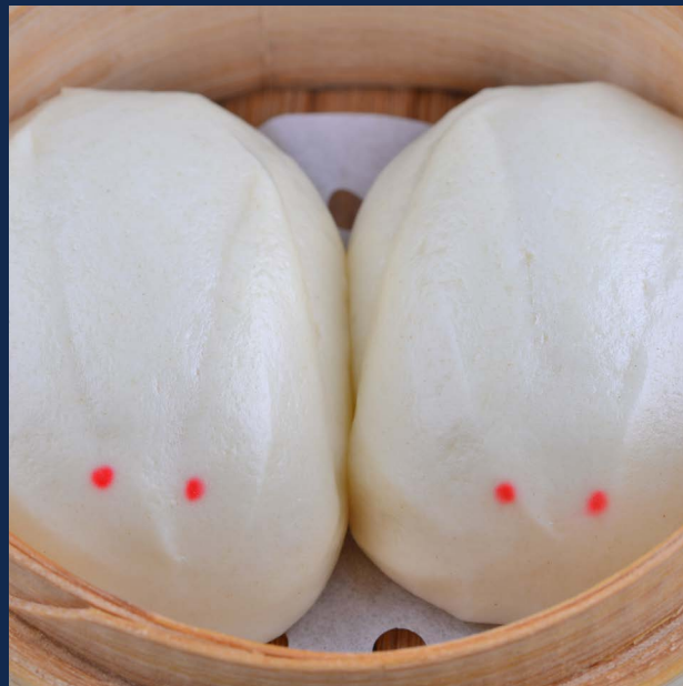
189. Pane dolce