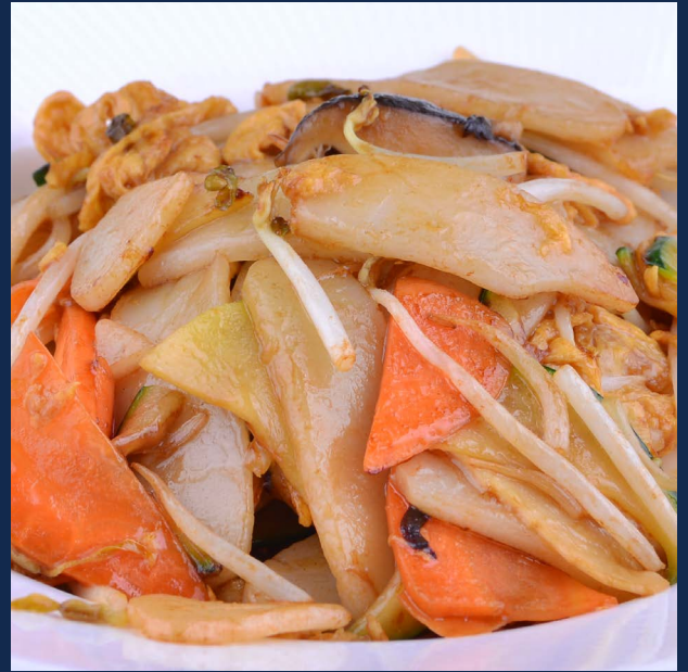
142. Gnocchi di riso con verdure